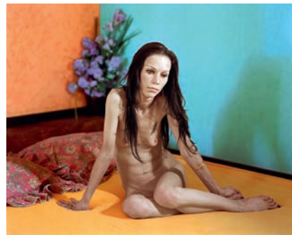
MALERIE MARDER, UNTITLED, 2010, Anatomy Series , archival pigment print, 23 x 30" / OHNE TITEL, alterungsbeständiger Pigmentprint, 58,4 x 76,2 cm.

MM: Das stimmt, das kenne ich. Es ist wie diese Art von Vergesslichkeit, die dich zum Beispiel nach der Geburt einstellt.